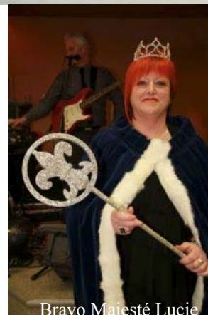
Bravo Majesté Lucie