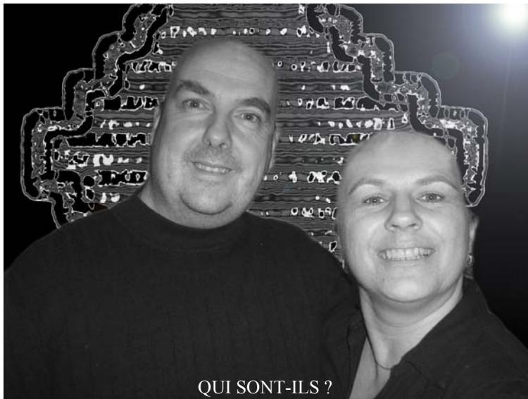
QUI SONT-ILS ?