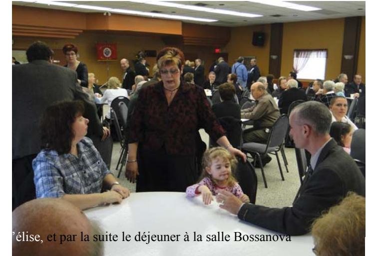
Photo souvenir de la messe du 55e anniversaire de fondation du Comité le 22 novembre 2011, à l'église, et par la suite le déjeuner à la salle Bossanova