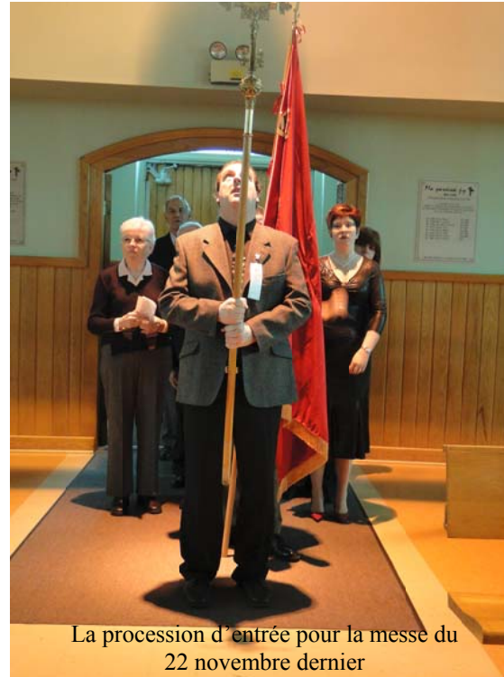
La procession d'entrée pour la messe du 22 novembre dernier