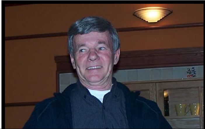
Salut à notre peintre , photo prise le 14 février 2007 à la St-Valentin