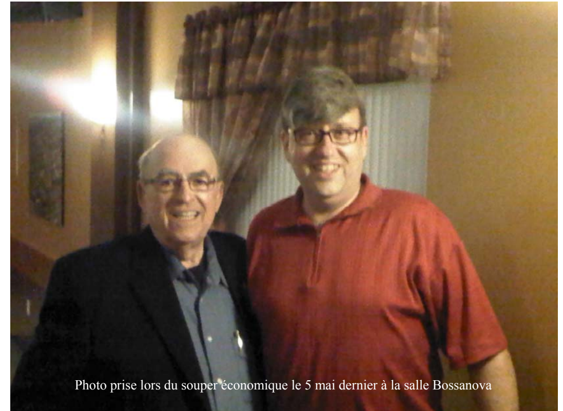
Photo prise lors du souper économique le 5 mai dernier à la salle Bossanova